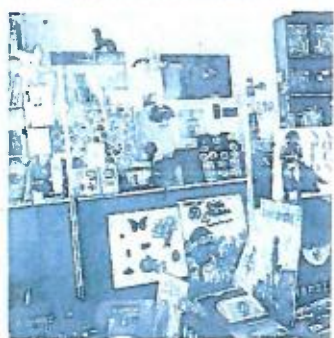
Isabelle Servais a mis à l'honneur des livres sur N